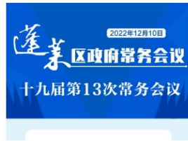
【一图读懂】蓬莱区召开第十九届政...