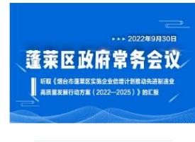
蓬莱区政府第11次常务会议：听取《...