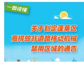
【一图读懂】《关于划定蓬莱区高排...