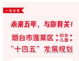
【一图读懂】《烟台市蓬莱区“十四...