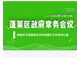
蓬莱区政府第13次常务会议：听取关...