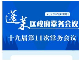
【一图读懂】蓬莱区召开第十九届政...