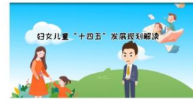
【动漫解读】《妇女儿童“十四五”...