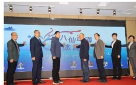
【新闻发布会】首届八仙过海体育节...