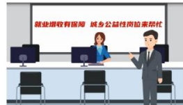
【动漫解读】就业增收有保障 城乡公...