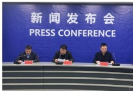
【新闻发布会】解读《蓬莱区重污染...